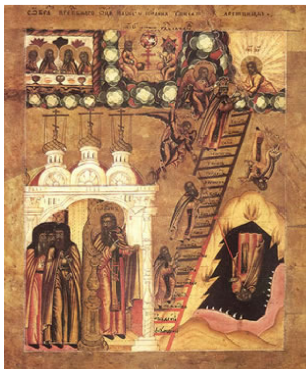
A Escada de São João Clímaco

Suplemento Litúrgico para os Domingos e Grandes Festas