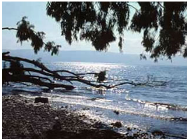
O Mar da Galiléia

O pescador é um homem do silêncio, da esperança e da perseverança. Quando sai para a pesca sua língua cessa para que os peixes não se assustem com o barulho das palavras. É um homem da esperança, pois aguarda sem afobação o momento certo para retirar as redes e coletar o fruto de seu trabalho. Às vezes espera toda uma noite, sem nada pescar, mesmo assim insiste em jogá-la de novo às águas. Por isso o pescador também é caracterizado como o homem da perseverança.